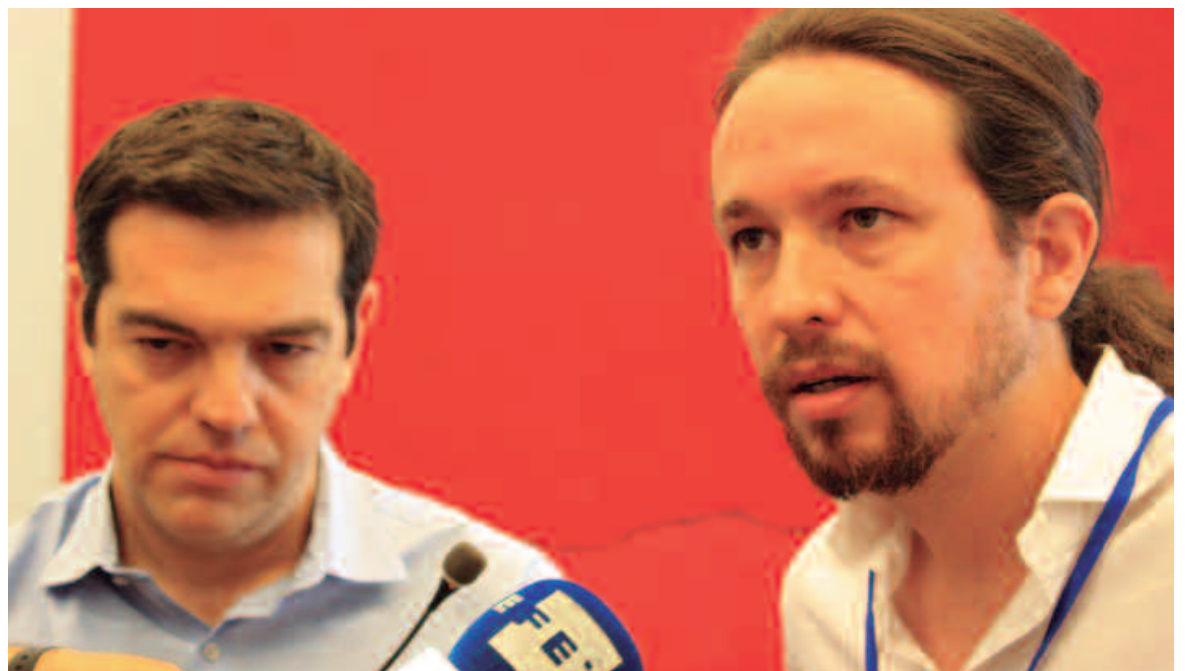
Alexis Tsipras y Pablo Iglesias, líderes de Syriza y Podemos

Por nuestra parte, consideramos que vivimos en la última década un ciclo de rebeliones populares en las que las masas han irrumpido en la escena política, una lenta pero sostenida acumulación de experiencias y también de construcción de los partidos revolucionarios. La experiencia de Syriza, Podemos y otras formaciones de este tipo han demostrado los límites insalvables del "reformismo sin reformas" en el contexto de la crisis capitalista internacional. Delimitarse claramente de estas formaciones no es "crimen de lesa sectarismo", sino al contrario una tarea esencial para elevar la conciencia de nuestra clase, para reforzar la lucha extraparlamentaria y la construcción de verdaderos partidos revolucionarios. Esta es la perspectiva a la que aportamos desde Socialismo o Barbarie.