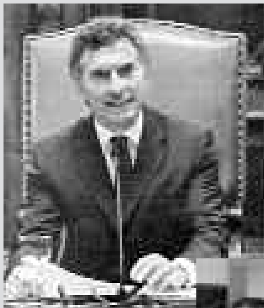
EL “PLENARIO” DE UTE

Pero esto no es todo, ya que total anuencia de la burocracia, la estabilidad laboral de los contratados y docentes interinos será “analizada” caso por caso y su situación se “resolverá” en noviembre de 2010. A todas estas agachadas de cabeza, la burocracia de la Celeste lo denomina “un acuerdo generoso” (claro que sin aclarar generoso para quienes...). A esta altura es más que evidente que CETERA, UDA, SADO, realizaron un acuerdo nacional para calmar la bronca de los docentes, evitar movilizaciones y paros garantizando el inicio de las clases y un miserable “techo” a las paritarias del resto de los gremios.