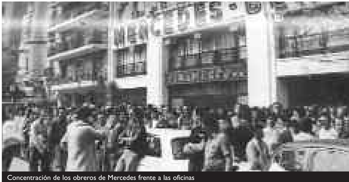
Concentración de los obreros de Mercedes frente a las oficinas

Eso es lo que entendieron nuestros compañeros. Y esto es lo que entiende el Nuevo MAS es la pelea definitiva en la cual comprometemos nuestro esfuerzo y honramos a nuestros compañeros.