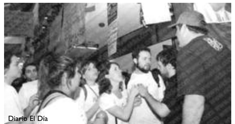
Diario El Día

las 18,45 horas, unos 200 militantes de la JUP de distintas facultades se adueñaron del primer piso de Humanidades. Pronto se produjo un fuerte entredicho con pares de izquierda. Cuando un miembro de la agrupación ¡Ya Basta! intentó quitar una bandera gigante con las fotos de Perón, Evita, Néstor y Cristina Kirchner, se temió lo peor. Pero los peronistas corrieron la bandera de lugar y siguieron cantando". En Bellas Artes actuaron de la misma manera, sacando del hall a todo aquel que