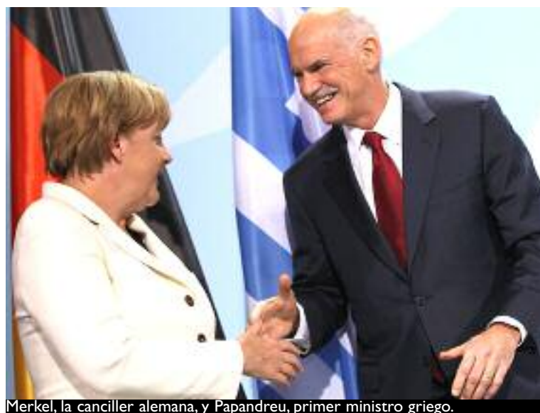
Merkel, la canciller alemana, y Papandreu, primer ministro griego.