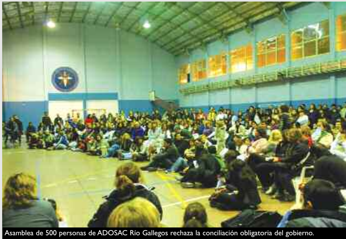
Asamblea de 500 personas de ADOSAC Río Gallegos rechaza la conciliación obligatoria del gobierno.

El conflicto de los maestros, agrupados en la Asociación de Docentes de Santa Cruz (ADOSAC) comienza en 2011 con paros progresivos en reclamo de aumento salarial. La situación se agudiza el 12 de abril, cuando una patota de la burocracia de la UOCRA ataca ferozmente a un grupo de compañeros docentes, de la salud y municipales de la Asociación de Trabajadores del Estado (ATE) que volanteaban en la ruta, a la entrada de la localidad 28 de Noviembre. Los compañeros golpeados debieron ser atendidos en Río Gallegos. La gravedad de la agresión se demuestra, por ejemplo, en la persona de un compañero, profesor de música que producto de esta salvaje golpiza sufre sordera aguda en ambos oídos. Frente a este hecho, los docentes de toda la provincia convocaron en forma urgente a un Congreso de ADOSAC, que se realizó en la misma localidad del sur de la provincia y votó el paro por