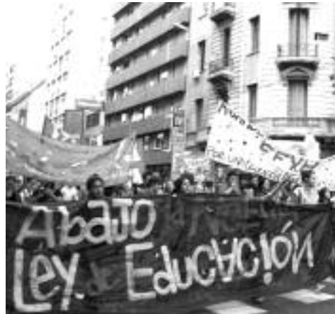
UNA INMENSA SOLIDARIDAD TRAS LA REPRESIÓN

En ese momento se realizó una asamblea que decidió avanzar con la intención de ingresar a donde estaban por votar la nefasta ley. No obstante, ni bien se llegó al vallado, los estudiantes fuimos encerrados por la policía, que salía desde todos lados con la intención de detener compañeros sea como fuere. De hecho, policías de civil hacían caer estudiantes para que la infantería los lleve presos. La decisión política del gobierno provincial era garantizar la votación, con cualquier costo y fuera lo que fuera lo que los estudiantes hiciéramos, la policía estaba dispuesta a reprimir y por eso se llevaron compañeras y compañeros detenidos arrastrándolos de los pelos.