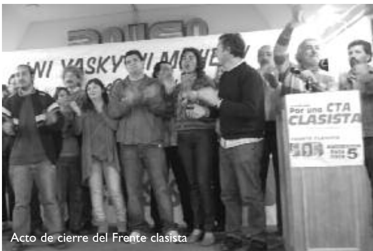
Acto de cierre del Frente clasista

dical sino política , llamando a construir un camino de independencia de clase.