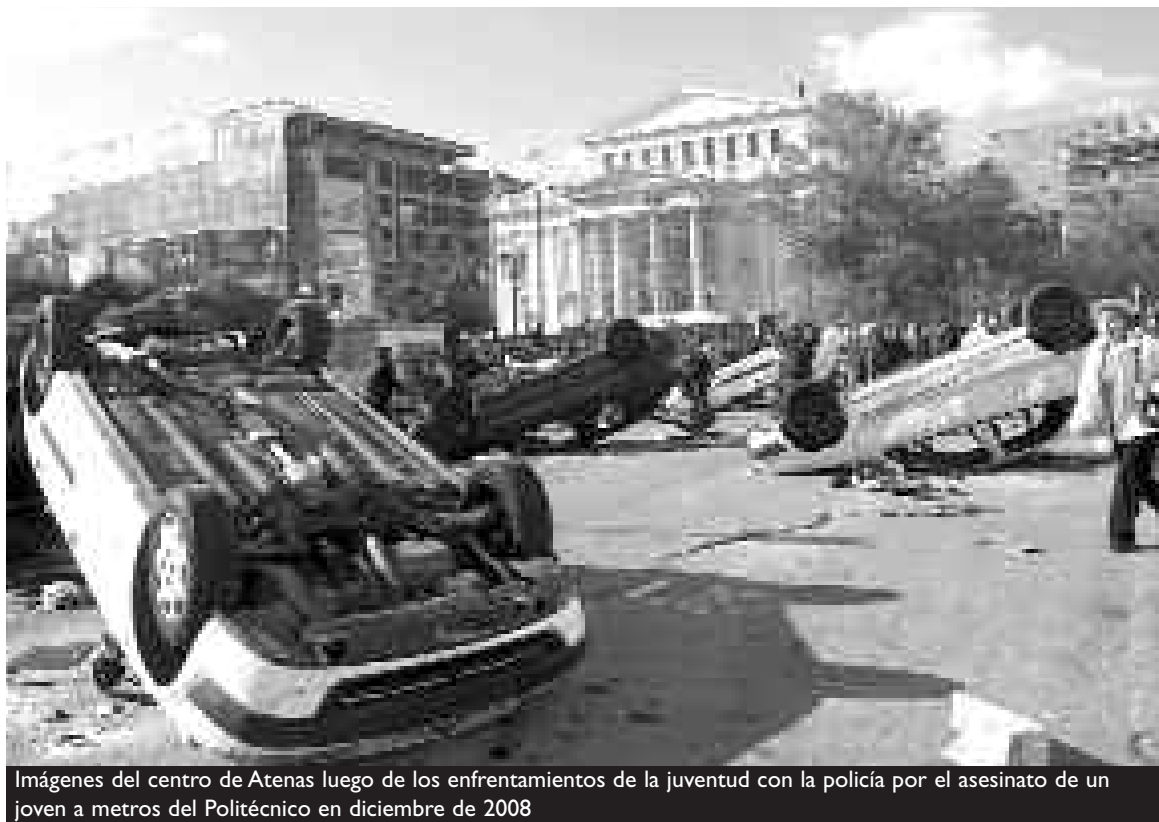
Imágenes del centro de Atenas luego de los enfrentamientos de la juventud con la policía por el asesinato de un joven a metros del Politécnico en diciembre de 2008