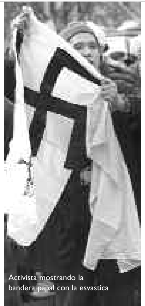
Activista mostrando la bandera papal con la esvástica

Desde Las Rojas nos parece muy importante que revean sus posiciones y saquen las conclusiones debidas, de cara a la próxima tarea que tenemos para seguir derrotando a la Iglesia, que es echarla de