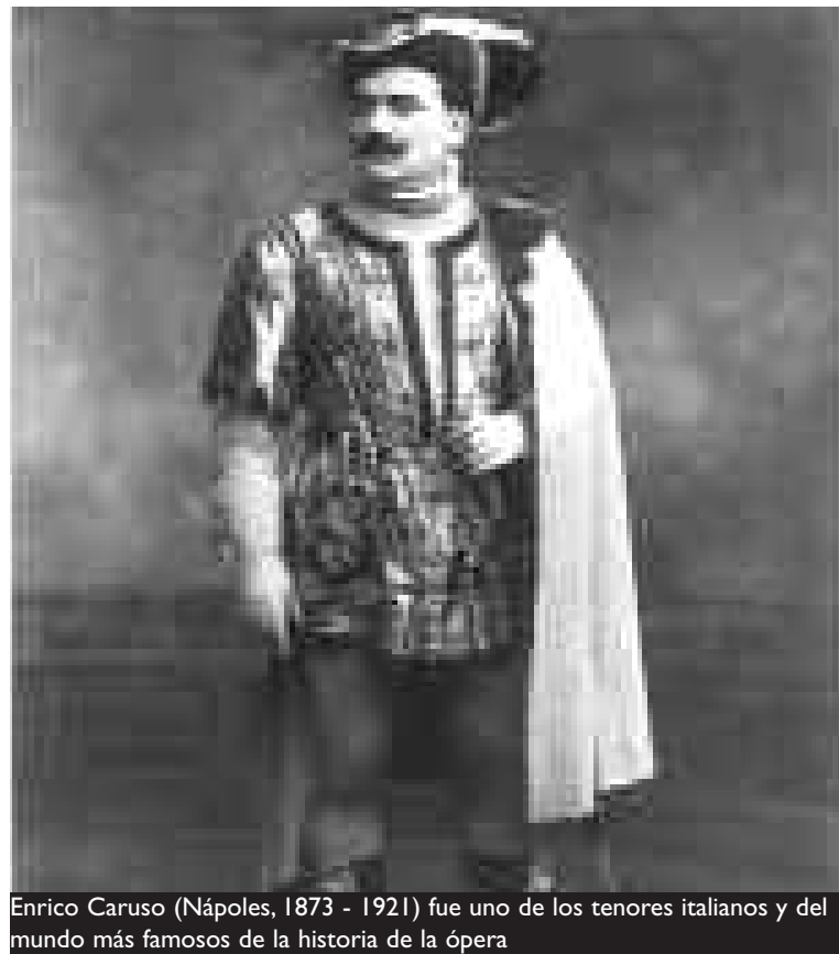
Enrico Caruso (Nápoles, 1873 - 1921) fue uno de los tenores italianos y del mundo más famosos de la historia de la ópera

Pero son esas conquistas las que gestiones neoliberales rabiosas como las del empresario Macri quieren terminar de desmantelar. Para ello en estas "reformas" en el segundo y tercer subsuelo del Colón donde funcionaban los talleres se están haciendo salas VIP de alquiler, tiendas y cafeterías, etc. Al mismo tiempo, los músicos fueron despojados de