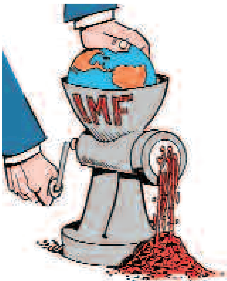
En la picadora de carne del FMI hoy no se salva nadie