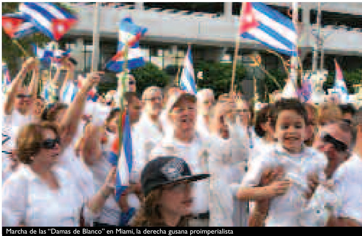
Marcha de las “Damas de Blanco” en Miami, la derecha gusana proimperialista

¡Y hay que decir que el desastre económico, social y político de la burocracia cubana está contribuyendo a que este peligro pueda hacerse realidad!