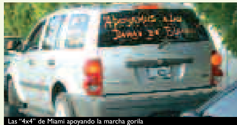
Las “4x4” de Miami apoyando la marcha gorila

Pero sucede que la única burguesía cubana que existe en el mundo vive en Miami (y además forma parte orgánica de la burguesía imperialista de EEUU). Son los llamados “gusa-