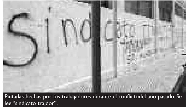
Pintadas hechas por los trabajadores durante el conflicto del año pasado. Se lee “sindicato traidor”.