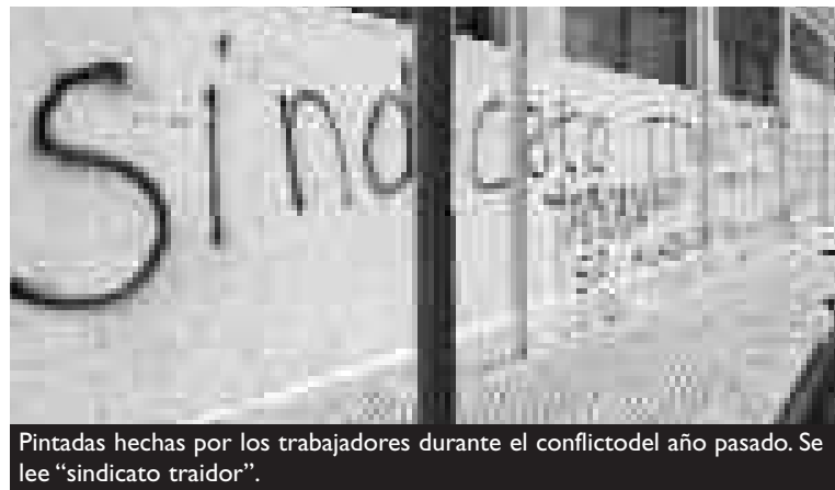
Pintadas hechas por los trabajadores durante el conflicto del año pasado. Se lee “sindicato traidor”.