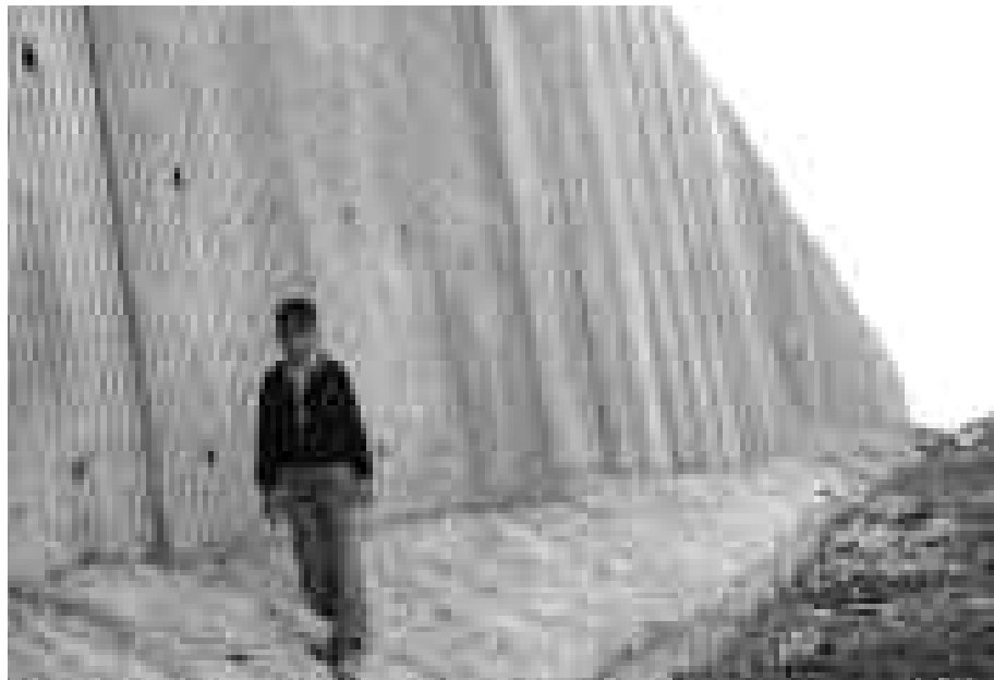
El Muro del Apartheid que rodea los guetos palestinos. El plan de Obama es montar con ellos la farsa de un "Estado Palestino". El gobierno de Israel ni siquiera acepta eso.

A grosso modo, hay dos políticas. La del actual gobierno de Israel es seguir hasta el fin la lógica de la colonización : es decir, el exterminio y/o traslado de la población palestina. No es una broma la propuesta de Avigdor Lieberman —ministro de Relaciones Exteriores— para la solución final de la "cuestión palestina": arrojar una bomba atómica en Gaza y expulsar a la población de Cisjordania a los países vecinos.[2]