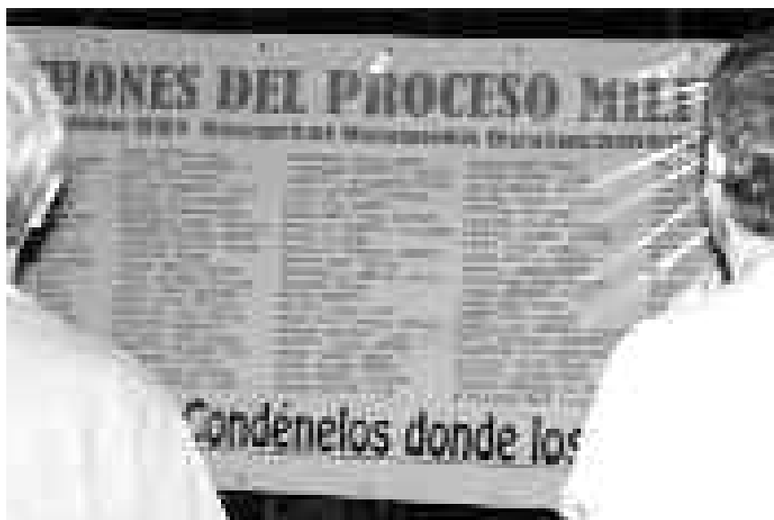
Listado de los servicios de inteligencia del batallón 601, publicado durante la marcha del 24 de marzo en Neuquén.

Hace unas semanas se dio a conocer el listado de alcahuetes del servicio de Inteligencia del Ejército durante el período de 1976 y 1983, con más de 4.300 milita-