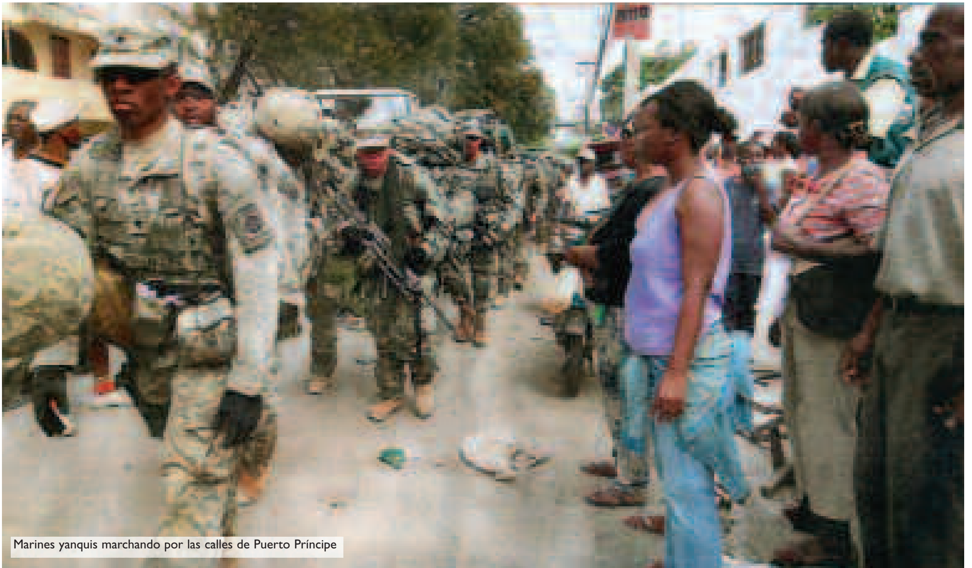
Marines yanquis marchando por las calles de Puerto Príncipe