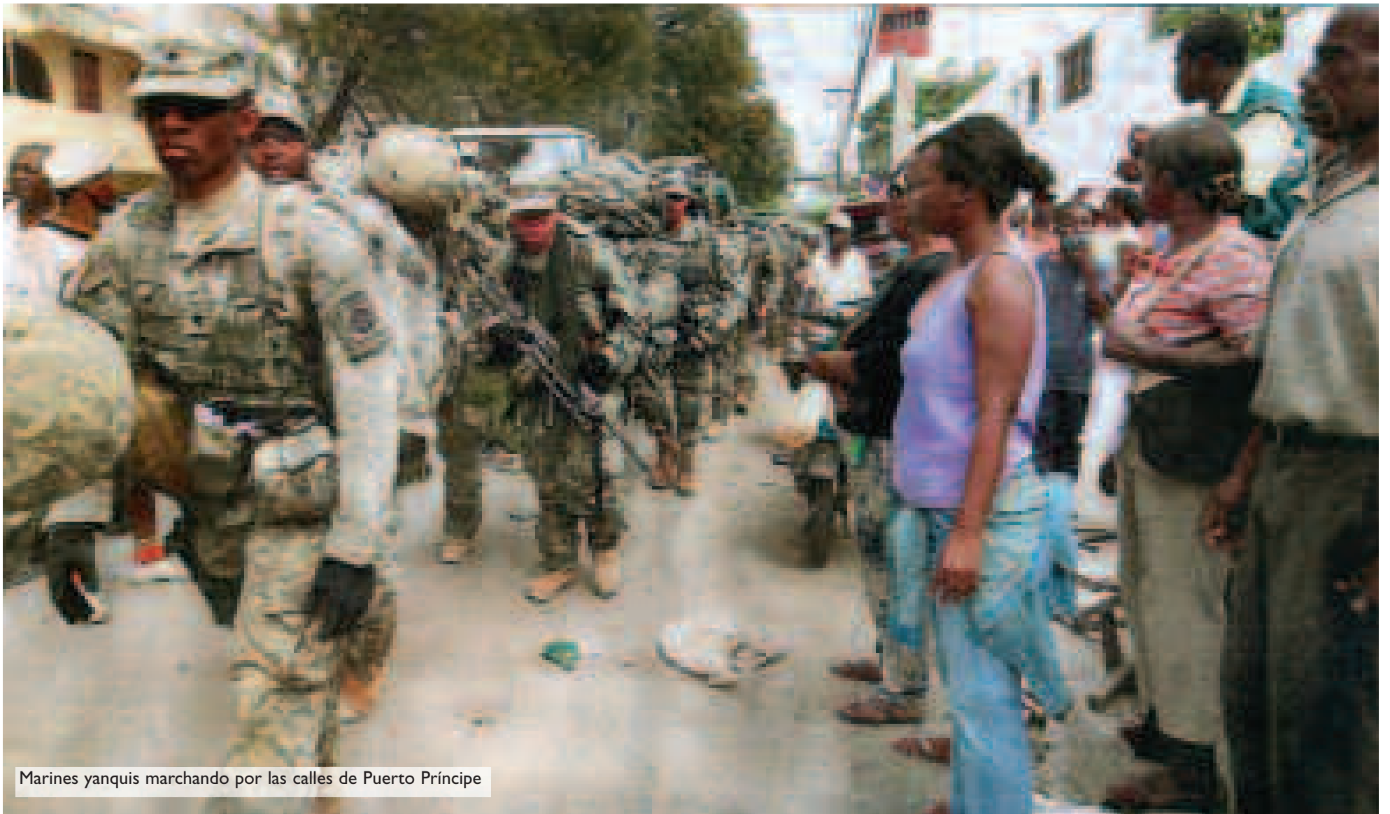
Marines yanquis marchando por las calles de Puerto Príncipe