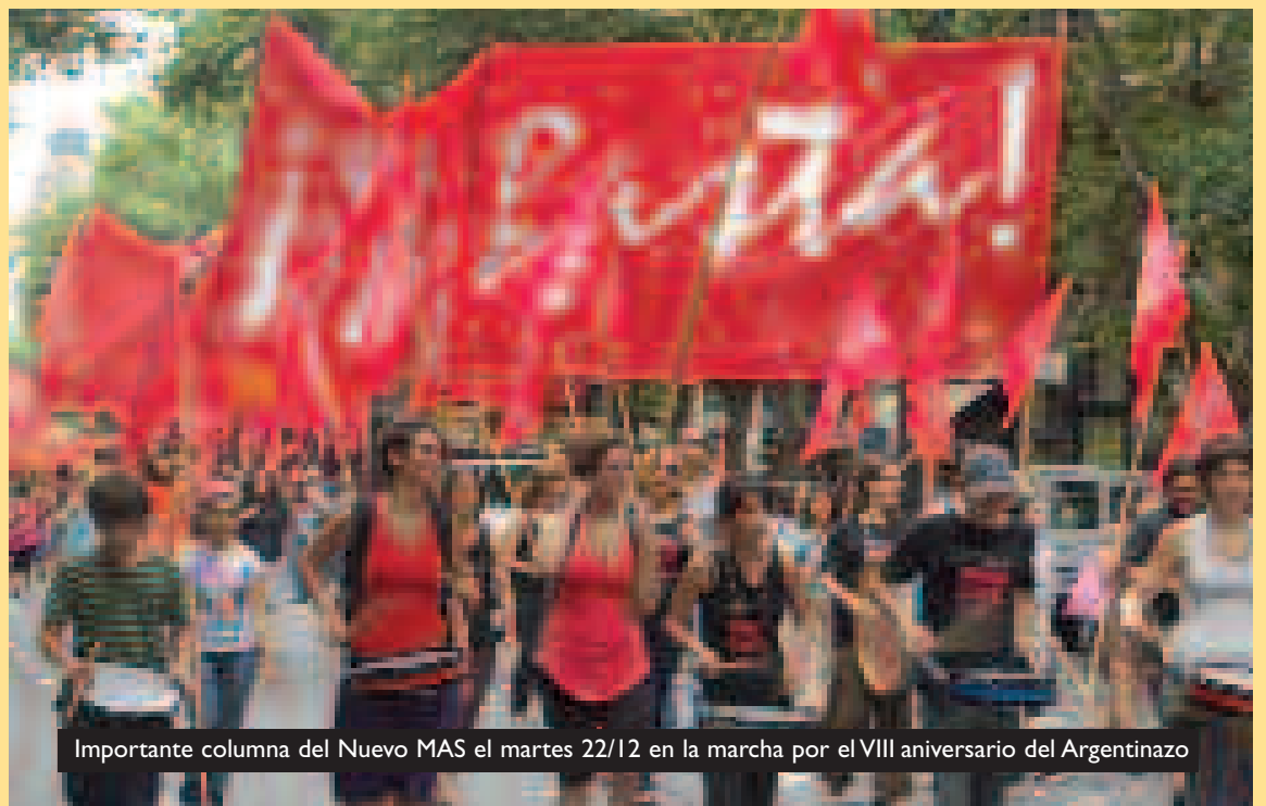
Importante columna del Nuevo MAS el martes 22/12 en la marcha por el VIII aniversario del Argentinazo

toda concepción sindicalista, corporativista y reformista termina en eso, comparten una visión posibilista de las cosas, no revolucionaria, una visión reformista de la realidad. Es un competidor importante pero no es el único, hay varios más competidores en la recomposición y por la estrategia de un nuevo movimiento obrero clasista. (...)