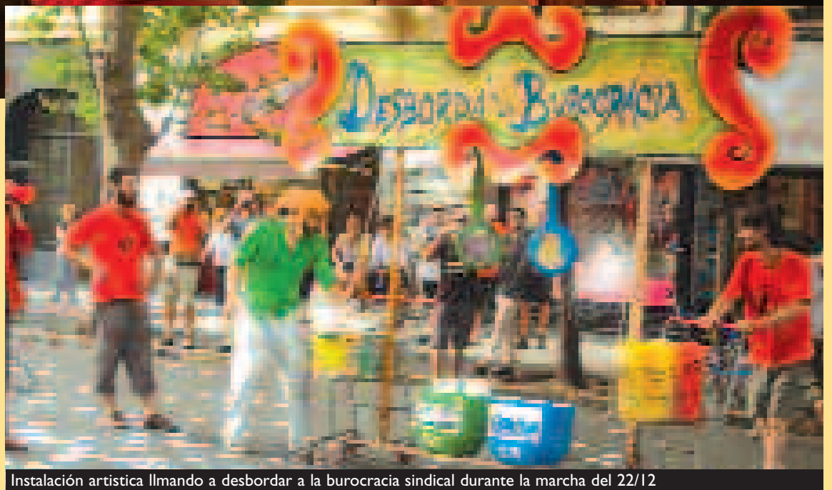
Instalación artística llmando a desbordar a la burocracia sindical durante la marcha del 22/12

Aparte de sindicalista es profundamente corporativa, porque consiguen cosas para ellos y lo que consiguieron no fue producto de ellos, fue producto del conjunto de la situación política y la