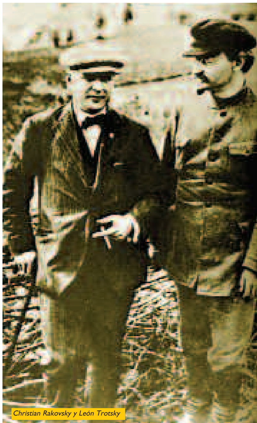
Christian Rakovsky y León Trotsky

mente a las cosas por su nombre. Las normas burguesas de reparto, al precipitar el crecimiento del poder material, deben servir a fines socialistas. Pero el Estado adquiere inmediatamente un doble carácter: socialista en la medida en que defiende la propiedad colectiva de los medios de producción; burgués en la medida en que el reparto de los bienes se lleva a cabo por medio de medidas capitalistas de valor, con todas las consecuencias que se derivan de este hecho. Una definición tan contradictoria asustará, probablemente, a los