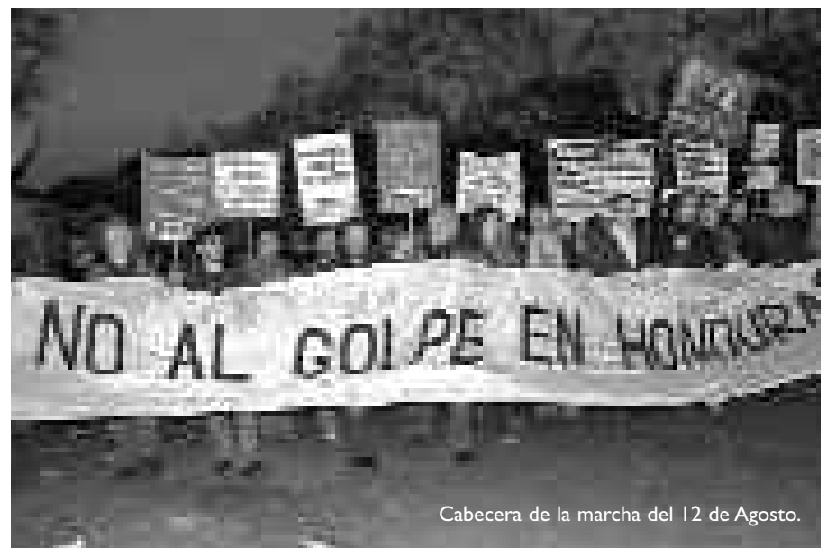
Cabecera de la marcha del 12 de Agosto.

Las organizaciones campesinas, los sindicatos y organizaciones estudiantiles, populares y de derechos humanos de Honduras libran una lucha heroica de movilizaciones, huelgas y acción directa contra el golpe y por la reinstalación, sin ningún tipo de condicionamiento, del presiden-