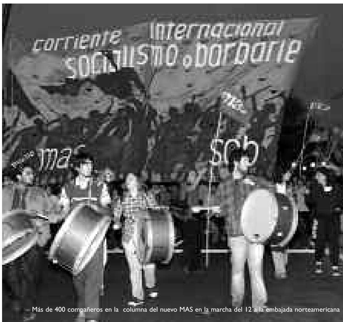
Más de 400 compañeros en la columna del nuevo MAS en la marcha del 12 a la embajada norteamericana