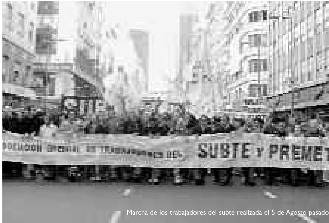
Marcha de los trabajadores del subte realizada el 5 de Agosto pasado.

El miércoles 5 de agosto los trabajadores del Subte se movilizaron en reclamo del reconocimiento de la Asociación Gremial de los Trabajadores del Subte y el Premetro, y por aumento de salarios. La importante marcha contó con más de mil trabajadores que manifestaron desde el Obelisco hasta el Ministerio de Trabajo. La marcha fue acompañada por organizaciones obreras y políticas, entre ellas el Nuevo MAS. Los trabajadores reclaman un aumento salarial del 25 % del básico, el 2 % del básico del conductor por año de antigüedad, la incorporación salarial al básico de la ley 26.341 y el aumento de los viáticos para los adicionales por función. La movilización se realizó en el marco de una importante mora por parte del Ministerio de Trabajo en otorgar la inscripción a la Asociación Gremial que conforman casi la totalidad de los trabajadores del Subte. A esto se suma la