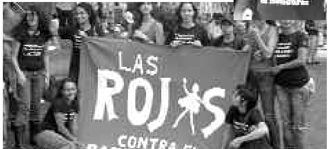
Las mujeres en lucha de Centroamérica realizaron una protesta en la Catedral 26 de junio (Costa Rica) en repudio al Golpe Militar en Honduras y a la complicidad por parte de la Iglesia en el mismo. Allí el PST Costa Rica, que pertenece a la corriente SoB, las compañeras impulsaron la actividad haciendo su primera aparición como Las Rojas.

En este escenario, donde la crisis capitalista empieza a agudizar los conflictos entre clases, en Honduras se está jugando el sentido de la tendencia latinoamericana de la lucha de clases , a la cual está indisolublemente ligada, la lucha de las mujeres. Por esto también es fundamental que el conjunto de las feministas y luchadoras intervengamos. Para hacerlo, es necesario tener una clara posición de independencia política , sin dejarnos arrastrar detrás de ningún sector patronal. Recordemos que en el último Encuentro Nacional de Mujeres, en pleno conflicto entre las patronales del campo y el gobierno, las corrientes que lo dirigen nos hicieron saludar “la lucha chacarera”, intentando llevar al movimiento de mujeres de Argentina detrás de los sectores más reaccionarios nucleados en la Mesa de Enlace, entre ellos la históricamente golpista Sociedad Rural... Un componente social que no se diferencia mucho de aquél que hoy ensancha las filas de las reaccionarias marchas blancas hondureñas que apoyan al gobierno de Micheletti, bendecidas por la Iglesia católica y evangélica, y al