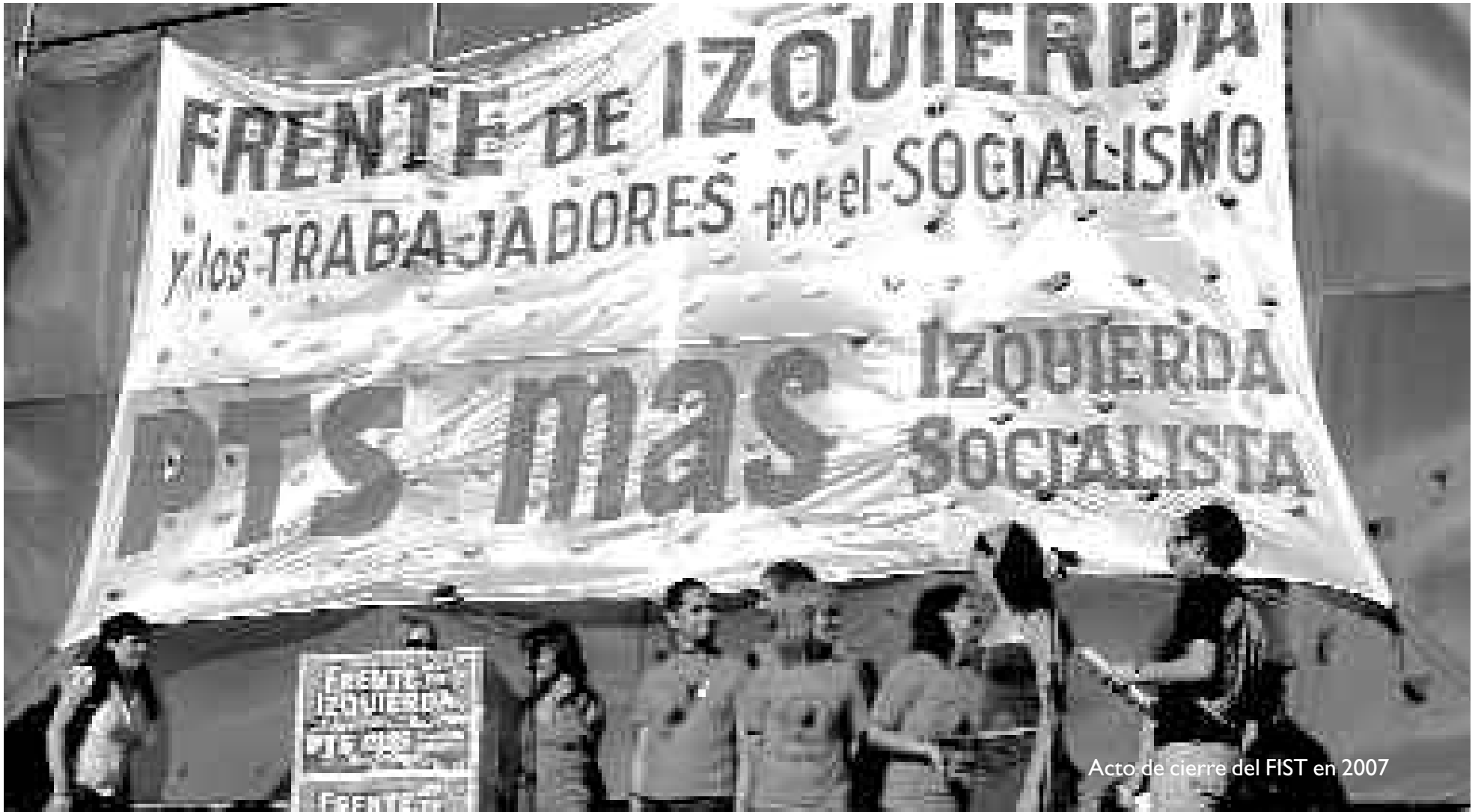
Acto de cierre del FIST en 2007

menos al nivel de los sectores de la amplia vanguardia, esta tendencia.