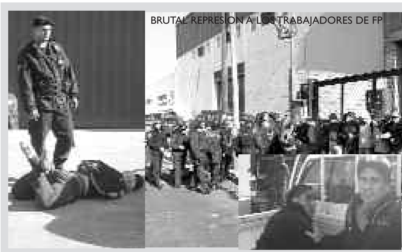
BRUTAL REPRESION A LOS TRABAJADORES DE FP