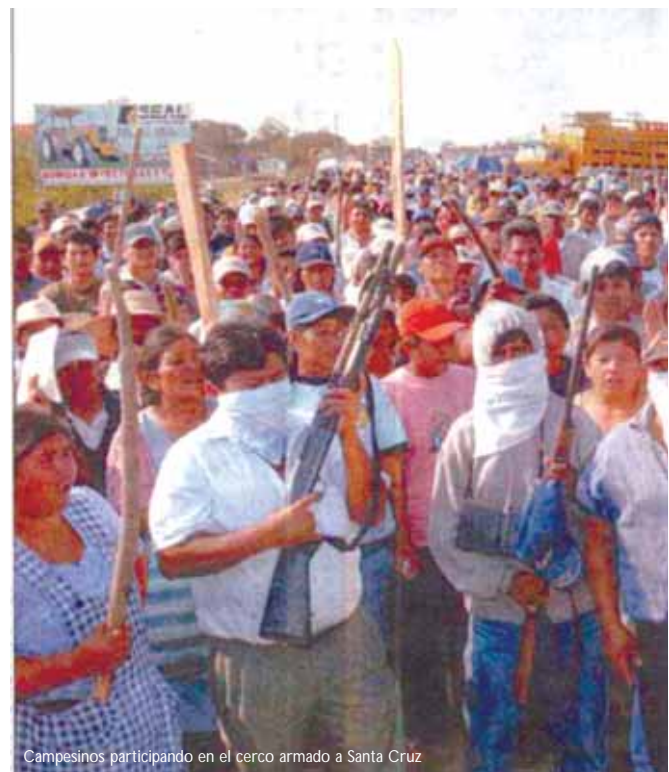
Campeños participando en el cerco armado a Santa Cruz

Así, los gobiernos “progresistas” de la región, encabezados por Lula