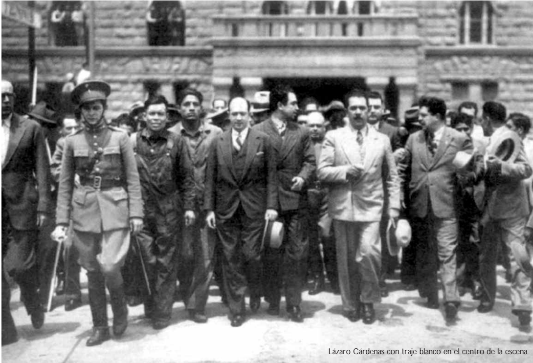
Lázaro Cárdenas con traje blanco en el centro de la escena

obreros del petróleo se encontraban divididos, cada compañía tenía su sindicato y las condiciones de trabajo y de vida eran deplorables. Las patronales negreras no respetaban la Ley Federal del Trabajo. En ese año (1934) estalla una oleada de huelgas en distintos sectores obreros. En enero pararon los petroleros, los electricistas de Veracruz, más de una decena de fábricas textiles, hubo huelga general en Tampico y de los tranviarios del Distrito Federal. En abril, pararon los trabajadores de servicios públicos en Mérida, Veracruz, Celaya y León, entre otras luchas.