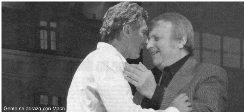
Gente se abraza con Macri

La gestión de Macri empezó con todo: impuestazo, "limpieza social" de la protesta en las calles, restricciones en los Hospitales públicos para "uso exclusivo de los porteños", cancelación de Festivales artísticos, quite de "Jornadas de reflexión docente" en las escuelas, desalojos de espacios culturales comunitarios, cierre de programas sociales, y centralmente toda una ola de despidos. A esta oleada han empezado a plegarse Scioli y demás gobiernos provinciales. El ejemplo cunde, y por supuesto que no por contagio, ya que lo que empieza a aparecer es el verdadero carácter de estos gobiernos: son neoliberales hasta la médula. Gobiernos en los que como siempre, los platos rotos los pagan los trabajadores, con más ajuste, más recortes al presupuesto y ahora con despidos masivos de los estatales precarizados, que vienen soportando hace años la peores condiciones de "trabajo en negro" y flexibilización que no son patrimonio exclusivo de los '90. Pero el orden fiscal y el achicamiento del gasto público no tendrán como correlato una mejor inversión en áreas sociales más necesitadas, sino la privatización y tercerización de servicios y funciones que son obligaciones ineludibles del Estado en salud, educación, etc. Con Macri, tendremos una ciudad que "va a estar buena" para unos pocos para los que quiere gobernar, y "más que