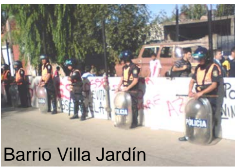
Barrio Villa Jardín

El extremo fue el intento de Gustavo Posse, intendente de San Isidro de levantar un muro para dividir el barrio residencial de la "Horqueta"