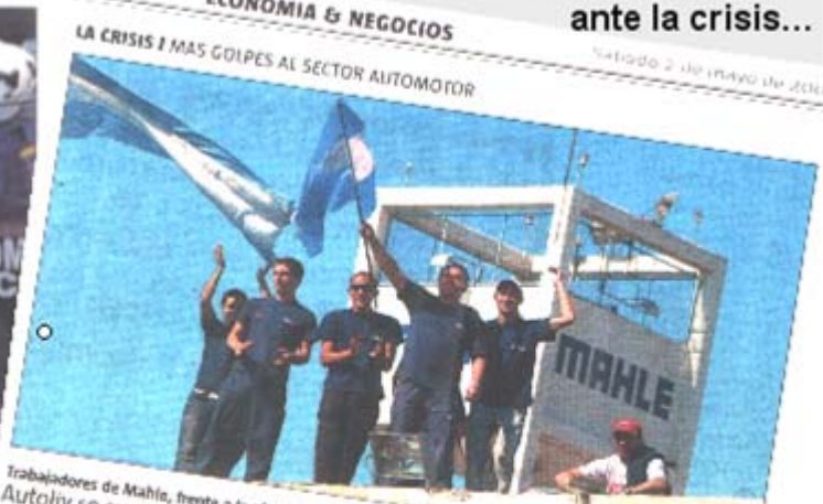
Trabajadores de Mahle, frente a la planta rosarina, realizaron un acto por el 1° de Mayo. AutoIv se suma al caso de Mahle, que se encamina hacia la expropiación