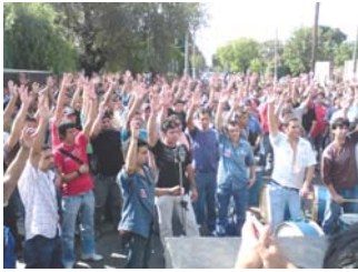
Compañeros de Vulca, Turno Azul

Llegar a decidir todos los temas referentes de nuestro convenio, decidir nuestro incremento salarial, todos los puntos y medidas a tomar mediante una asamblea es un privilegio, derecho conquistado con la fuerza y unión de todos nosotros, por eso cuando nos reunamos en asamblea para tratar un tema de mucho interés para nosotros y nuestras familias es muy importante que todas las personas presentes estemos atentos, en condiciones optimas y no en estado de falta de sobriedad, con esto no quiero señalar a nadie pero quería concientizar a toda la gente para tratar de estar en el momento de los debates, votaciones y no llegar cuando esta finalizo, por que es importante que todos opinemos y decidamos nuestro futuro.