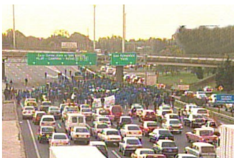
8 de mayo de 2007, Panamericana y Marquez